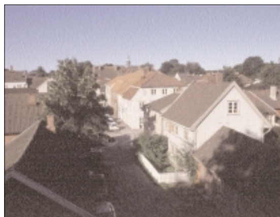
Fra Gamlebyen i Fredrikstad, der Stiftelsen Byens Fornyelse arrangerer Sommerskolen 2002.